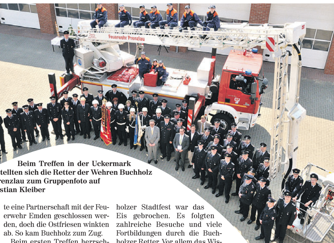
Beim Treffen in der Uckermark stellten sich die Retter der Wehren Buchholz und Prenzlau zum Gruppenfoto auf

Die Initiative ging von den Prenzlauer Rettern aus, die von dem technischen Know-How der westdeutschen Kameraden profitieren wollten. Ursprünglich soll-