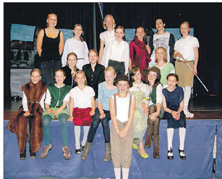
Die Schauspiel-AG des Albert-Einstein-Gymnasiums begeisterte mit einer Shakespeare-Aufführung