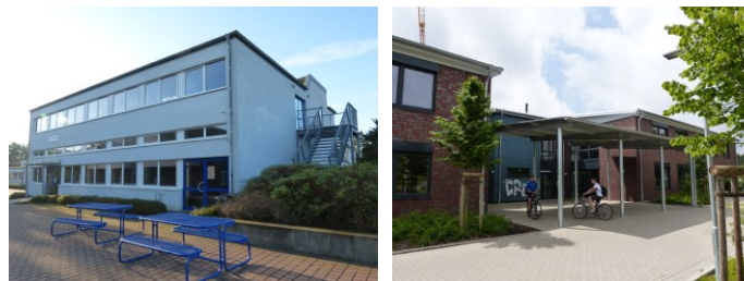
Das Hauptgebäude (oben), das Nebengebäude (u.l.), das Jahrgangshaus (u.r.)